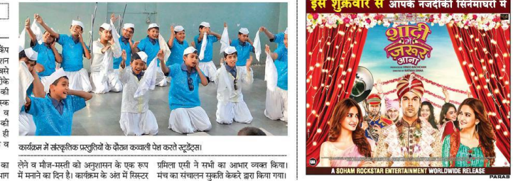
कार्यक्रम में सांस्कृतिक प्रस्तुतियों के दौरान कबाली पेश करते स्टूडेंट्स।

कैम्पियन स्कूल औरा सोलैनी में कबिंग-डे कैम्प का आयोजन किया गया। इसमें प्रायमरी सेवानिवृत्त के सैकड़ स्टूडेंट्स ने हिस्सा लिया। सबसे पहले सभी स्टाफट कम्प ने अनुशासित तरीके से स्काउट ध्वज को सलामी की श्रद्धालु में विभिन्न खेल, चार्ट मेकिंग, मार्क मेकिंग, बटन लगाओ, लिफाफा बनाओ व विभिन्न सांस्कृतिक गीत-संगीत व नृत्यों की कार्यक्रमों में शांवर प्रस्तुति दी गई। साथ ही स्काउट्स ने कबाली, ओलीरी, सांस्कृतिक व केन्द्रन द्वारा गतिविधियों में भी भाग लिया।