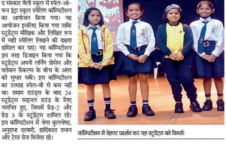
कॉम्पिटिशन में वेक्टर प्रदर्शन कर रहे स्टूडेंट्स को सिटी रिपोर्टर